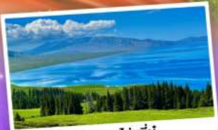
ทะเลสาบไซหลินอู๋

เที่ยวทุ่งหญ้าคอกฟ้า นาราตี ชมความสวยงามทะเลสาบไซหลินอู๋