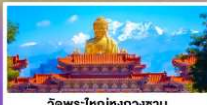
วัดพระใหญ่ทงกวงชาน