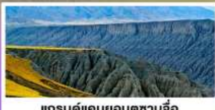
แกรนด์แคนยอนดูซานจื่อ