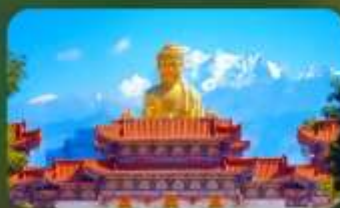
วัดพระใหญ่หรงกวงซาน