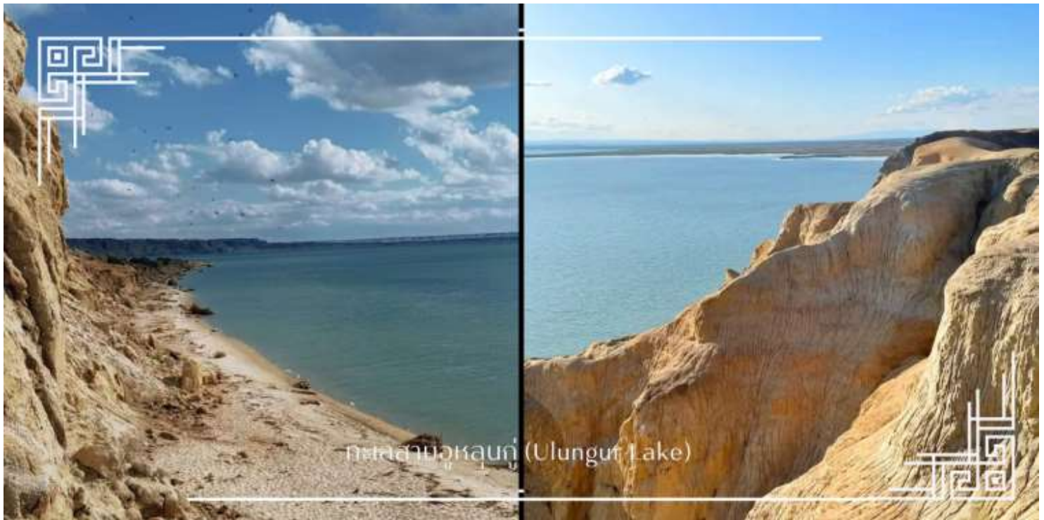
ทะเลสาบอุหลุนกู่ (Ulungur Lake)

นำท่านเดินทางผ่านทางด่วน S21 (Awu Expressway) (ใช้เวลาประมาณ 4.30 ชั่วโมง) ทางด่วนสายแรกที่ตัดผ่านทะเลทรายในเขตปกครองตนเอง ซินเจียงอุยกูร์ เชื่อมระหว่างนคร อูร์มุฉี และเมือง อัลไต ถือเป็นผลงานวิศวกรรมสำคัญที่ออกแบบพิเศษเพื่อรองรับสภาพทะเลทราย พร้อมระบบป้องกันทรายและค้ำยันถึงสิ่งแวดล้อมอย่างรอบด้าน จากนั้นนำท่านแวะชม ทะเลสาบอุหลุนกู่ (Ulungur Lake) เป็นทะเลสาบน้ำจืดขนาดใหญ่ ใกล้กับเมือง อัลไต นับเป็นหนึ่งในแหล่งน้ำธรรมชาติที่สำคัญของภูมิภาค และเป็นแหล่งประมงน้ำจืดที่มีชื่อเสียงของจีนตะวันตก ทะเลสาบแห่งนี้มีพื้นที่กว้างใหญ่ โอบล้อมด้วยทุ่งหญ้าสเตปป์และภูมิประเทศกึ่งทะเลทราย ทัศนียภาพโดยรอบมีความงดงามและเงียบสงบเหมาะสำหรับการท่องเที่ยวเชิงธรรมชาติ การพักผ่อน และการถ่ายภาพ