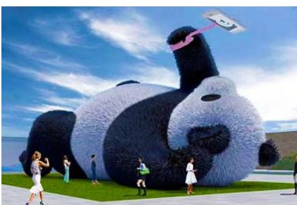
ตุ๊กตาแพนด้าเชลฟี

ระหว่างเดินทางท่านสามารถชมทัศนียภาพธรรมชาติอันงดงามของสองข้างถนนขณะที่รถแล่นผ่าน ที่มีทั้งภูเขาหิมะสูง หุบเขา ธารน้ำ และทุ่งหญ้าบนที่ราบสูง หรือพักผ่อนตามอัธยาศัยบนรถระหว่างเดินทาง