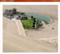
เขื่อนทรายหมิงซาซาน