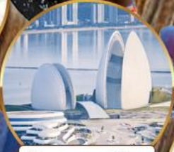
โรงแรมหรูไฮมุก