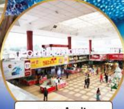
ตลาดกึ่งเปีย