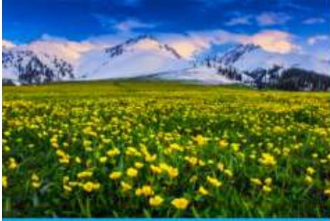
ทุ่งหญ้าลวยฟ้านาลาถิ

พักที่ WAN SEN HOTEL ระดับ 4 ดาวท้องถิ่นในตำบลนาลาถิ