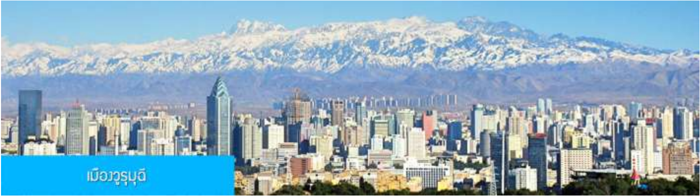
เมืองูรูมูฉี