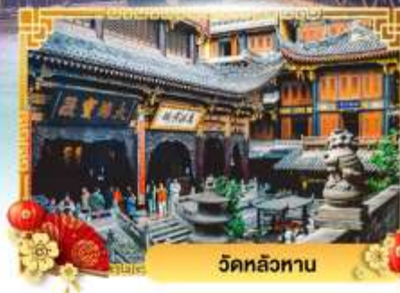
วัดหลัวหนาน