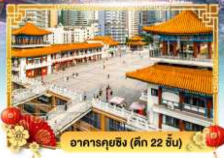
อาคารคิงซิง (ตึก 22 ชั้น)