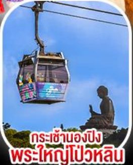
กระเช้าองปีง พระใหญ่ไผ่หลิน