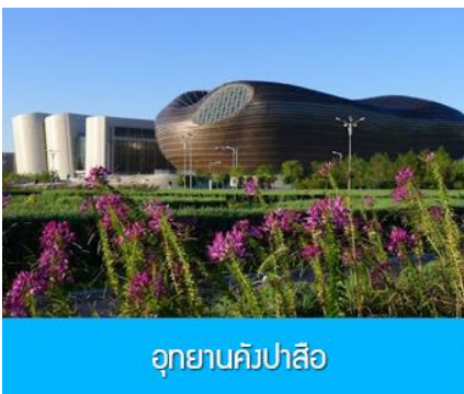
อุทยานคังปาสือ