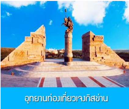
อุทยานก๋วยเกี้ยวเจงกิสข่าน