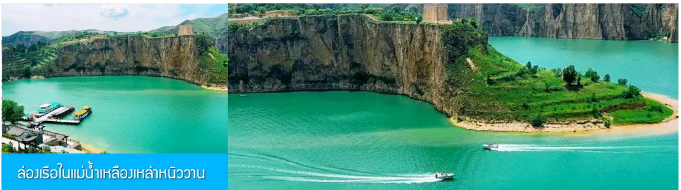
ล่องเรือในแม่น้ำเหลืองเหล่าหนิววาน

เที่ยง รับประทานอาหารกลางวัน ณ ร้านอาหารระหว่างทาง (8)