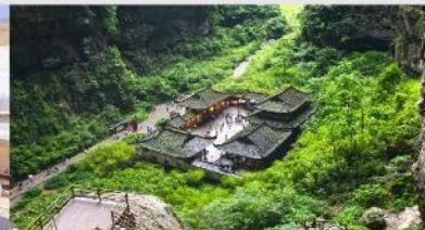
อุทยานแห่งชาติบ่อหลุมฟ้า

*ทางบริษัทฯ ขอสงวนสิทธิ์ในการสลับโปรแกรมทัวร์ตามความเหมาะสมขึ้นอยู่กับสถานการณ์หน้างาน โดยคำนึงถึงผลประโยชน์ของลูกค้าเป็นสำคัญ