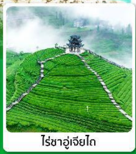
ไร่ชาอู๋เจียโต