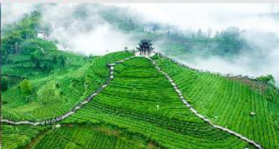
ไร่ชาอู่เจียโต