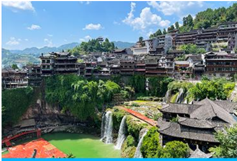
เมืองโบราณ ฝูหรงเจิ้น