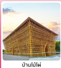
บ้านไม้ไผ่

ไอโกล์ เที่ยวครบ สวนน้ำ Aquatopia & สวนสนุก Vin Wonder เวนิสแห่งเวียดนาม Grand World Phu Quoc แลนด์มาร์คสุดโรแมนติก