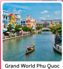
Grand World Phu Quoc