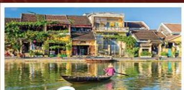
เมืองโบราณเฮอฮอัน

! พักบนเขานำฮิลล์ 1 คืน ! สัมผัสอากาศเย็นตลอดปี สตรีตฟรังเศสสุดคลาสสิก - นั่งกระเช้ายาวที่สุด สู่มานาฮิลล์ สนุกสุดมันส์ไปกับสวนสนุก The Fantasy Park มีบริการเช่าแม่ทวนอิมองค์ใหญ่ที่สุดของเมืองดานัง - เช็กอินเมืองมรดกโลกฮอยอัน - สนุกสนานไปกับกิจกรรม!!นั่งเรือกระดิง หมู่บ้านกัมถาน เช็กอินร้านกาแฟ SON TRA MARINA CAFE - ไม่หลงร้านช้อปปิ้ง - อิ่มอร่อยกับบุฟเฟ่ต์นานาชาติ , หม้อไฟซีฟู้ด