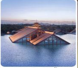
พิพิธภัณฑ์ไต้น้ำ กวางฟู่หลิน