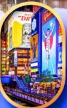
ย่านชิบโฮบาชิ