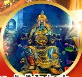
วัดปักไต้ฮ้องอำ