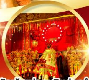
วัดเจ้าแม่กวนอิมฮ้องอำ