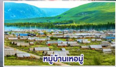
หมู่บ้านห่อมู่