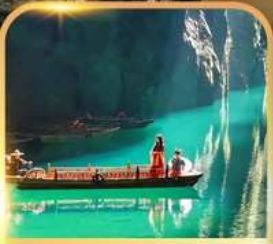
แกรนด์แคนยอนผิงซาน