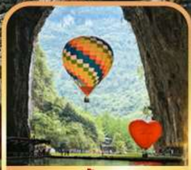
อุทยานถ้ำเทีงหลง