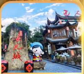
เมืองเทพริดาตุ๋เจีย