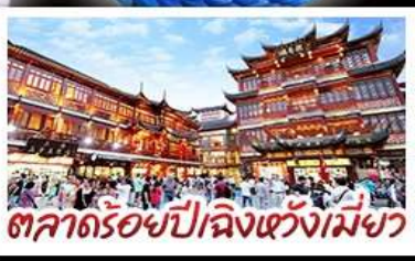
ตลาดร้อยปีเฉิงหวังเมี่ยว