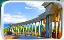
1st President Park