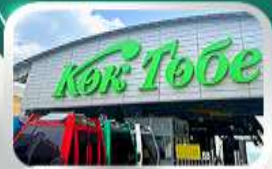
ซิ่นโทกโทเบซมวิวอัลมาตี

นั่งกระเช้าซิมบูลัค-ทะเลสาบโคลไซ-โบสถ์เซมคอฟ