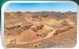
ชารินแกรนด์แคนยอน