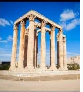
Temple Of Olympian