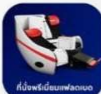
ที่นั่งพรีเมียมเฟลตเบด

บริการอาหารร้อน และ น้ำดื่ม บนเครื่อง ขาไป และ ขากลับ