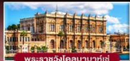
พระราชวังโดลมาบาห์เซ่