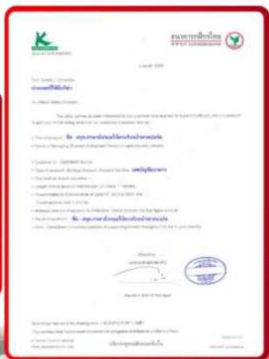
ตัวอย่าง Bank Guarantee ที่ยื่นได้ตั้งกับธนาคาร