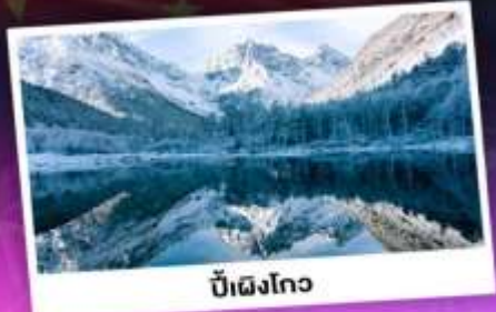
บี้ฝิงโกว

เทือกเขาแอลป์เมืองจีน "ภูเขาซีครุณี" ชมความสวยงามของอุทยานบี้ฝิงโกว