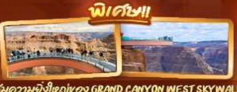
ชมความยิ่งใหญ่ของ GRAND CANYON WEST SKYWALK