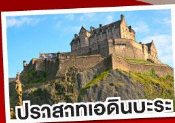
ปราสาทเอดิเนบะระ