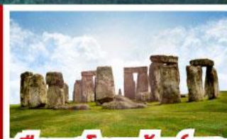
เยือนสโตนเฮนจ์ และ พิพิธภัณฑน์โรมันบาร