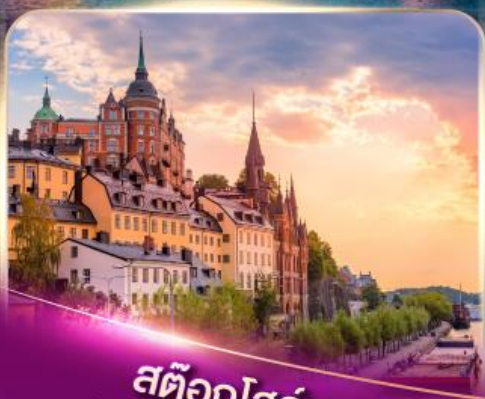
สต็อกโฮล์ม เวนิสแห่งยุโรปเหนือ