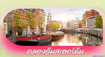
คลองอัมสเตอร์ดัม