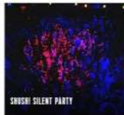
SHUSHI SILENT PARTY