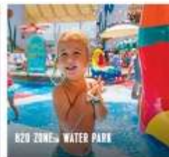
B20 ZONES WATER PARK