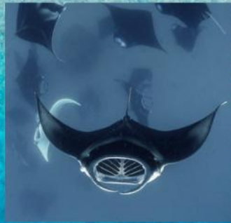
Manta Ray Snorkeling