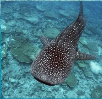
Whale Shark Snorkeling