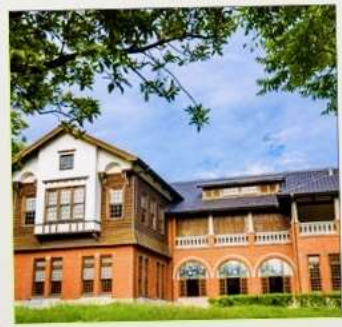
พิพิธภัณฑ์น้ำพุร้อนเป่ย์โถว